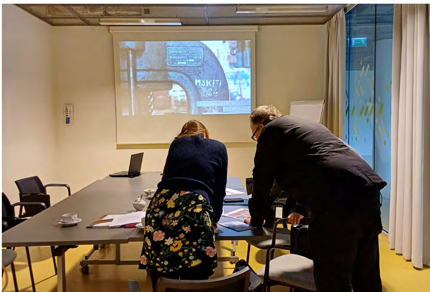
Setkání s kurátory muzea.