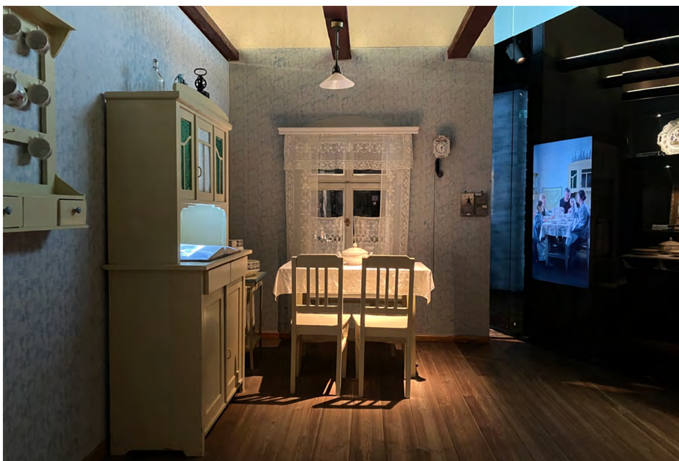
Rekonstrukce historické kuchyně v expozici Světlo dějin: Horní Slezsko v historii je nejoblíbenějším místem školních návštěv, protože žákům nabízí známé prostředí, se kterým se snadno ztotožní.