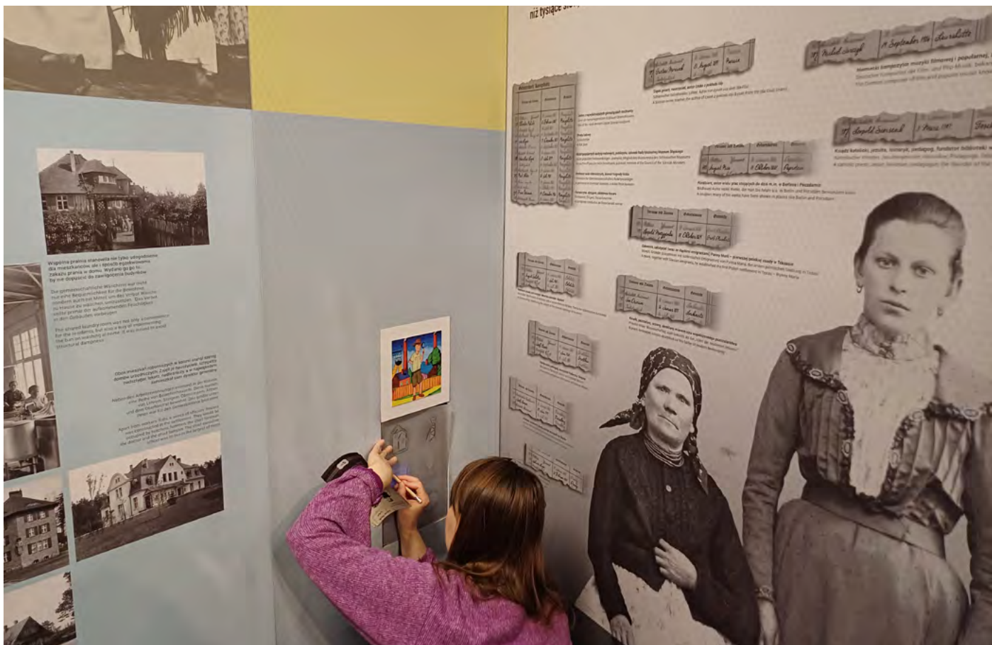
Dětská linka v historické expozici Světlo dějin: Horní Slezsko v historii.