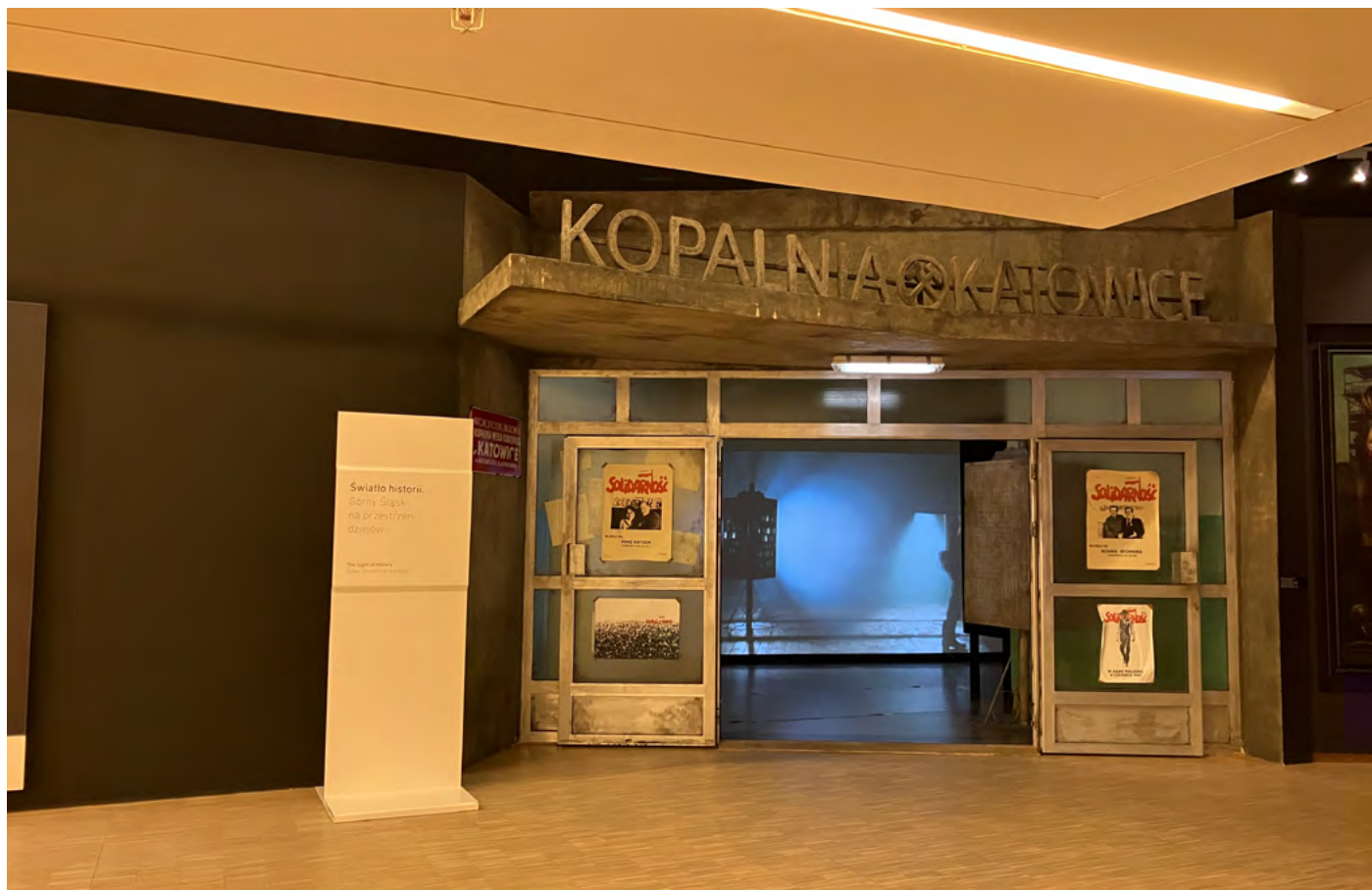
Rekonstrukce vstupu do dolu Katowice. Vstup do hlavní historické expozice: Světlo dějin: Horní Slezsko v historii.