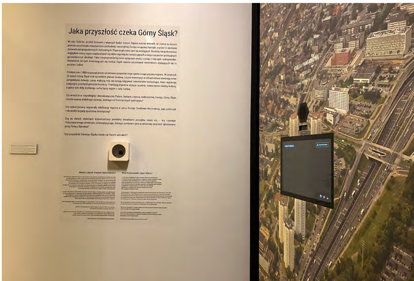
Prvek zapojení návštěvníků do expozice: Jaká budoucnost čeká Horní Slezsko?