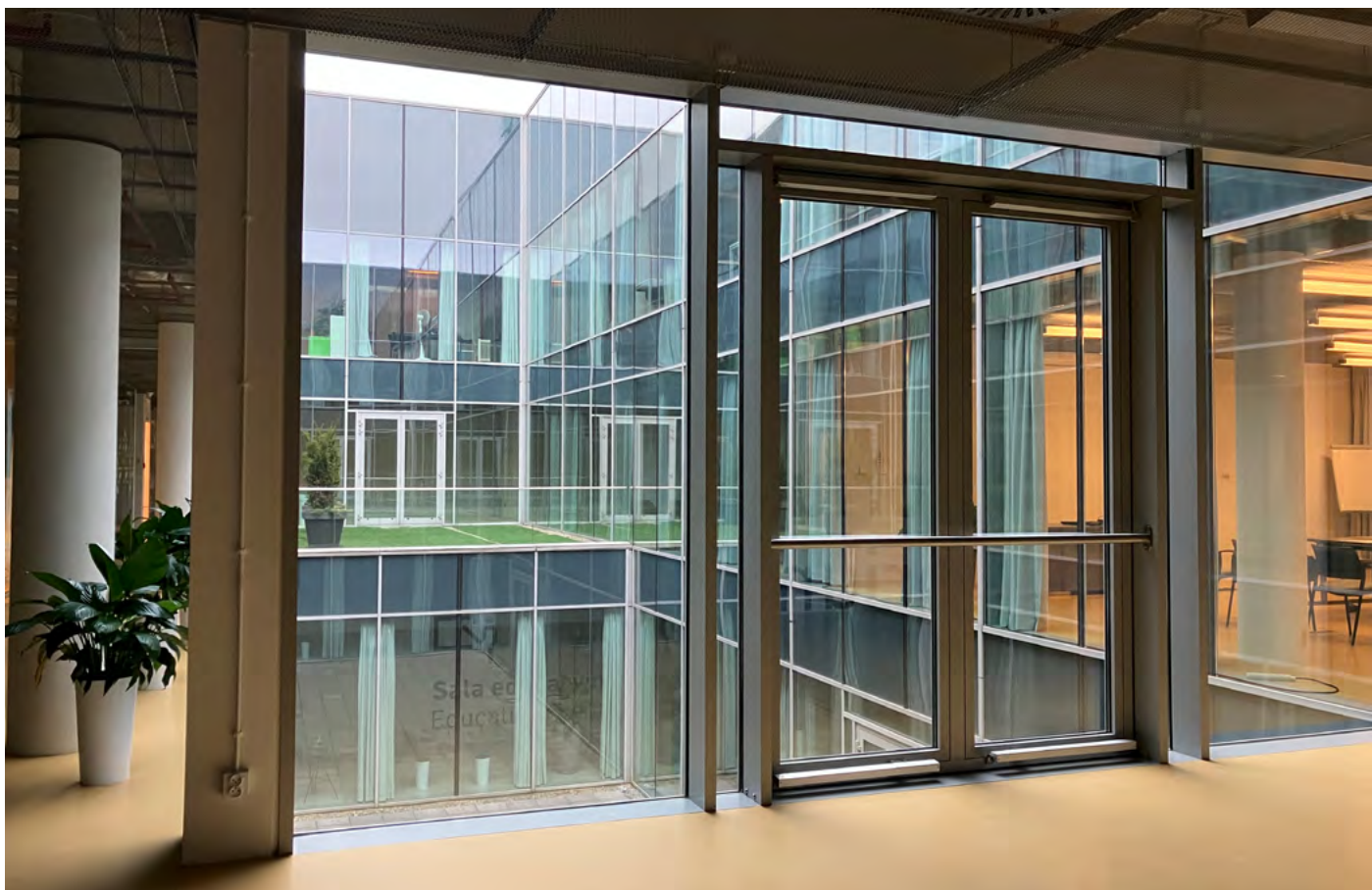
Osvětlení podzemních prostor administrativní budovy pomocí vyhloubeného atria.