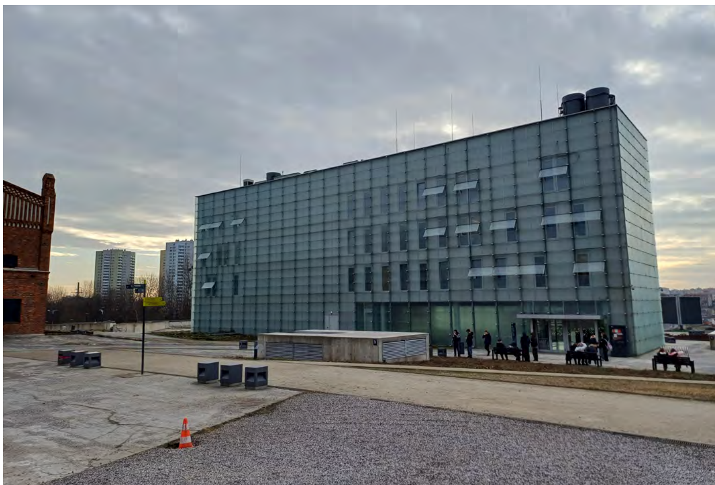
Administrativní budova muzea.