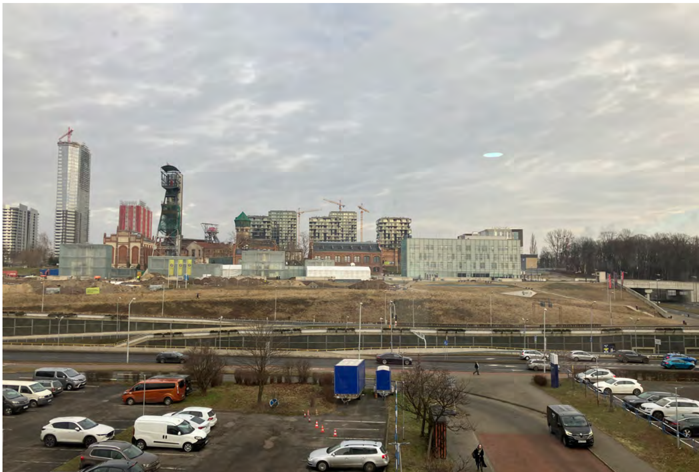
Pohled na celý areál muzea.