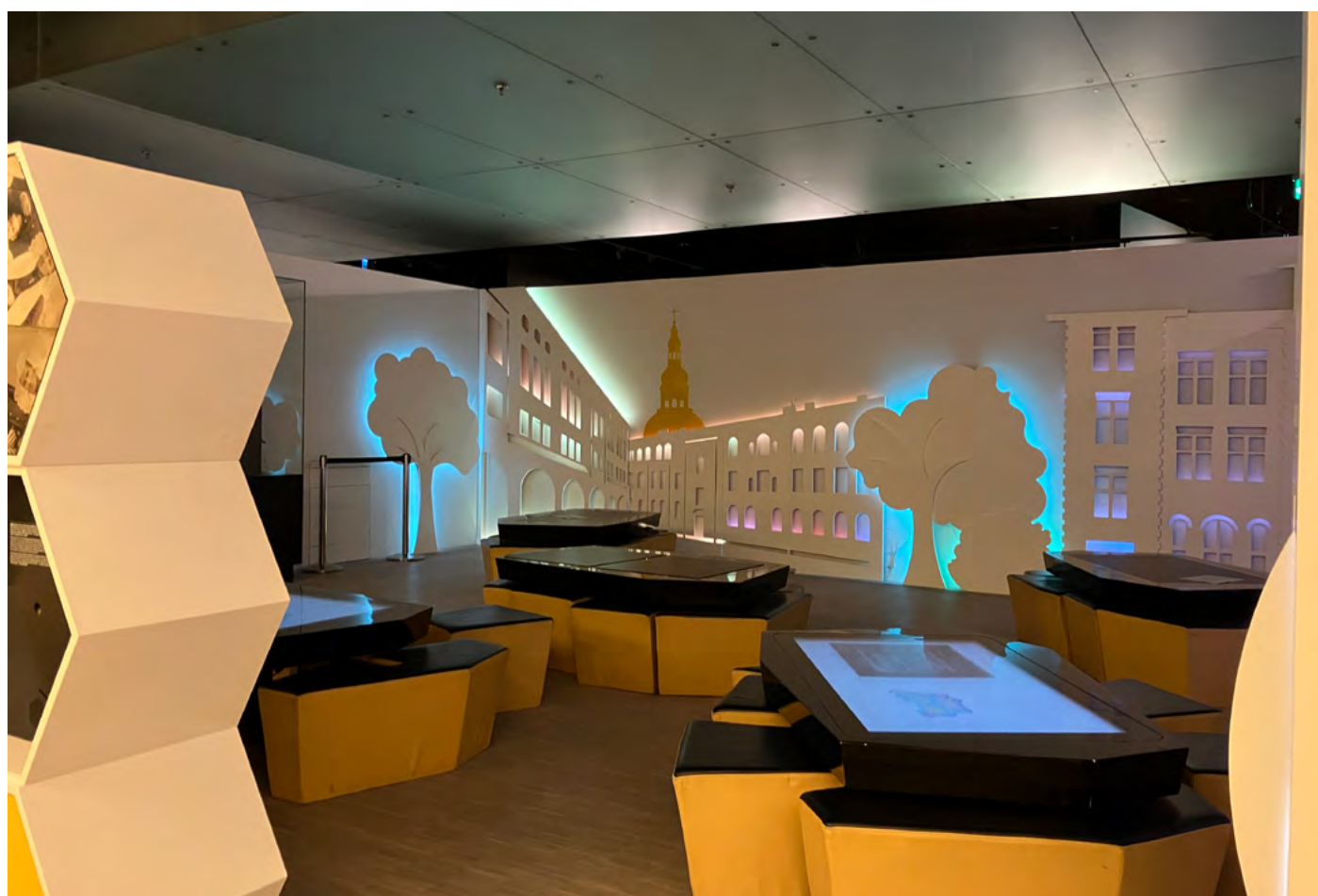
Odpočinkový prostor pro rodiny s dětmi, jednotlivce i školní skupiny před expozicemi.