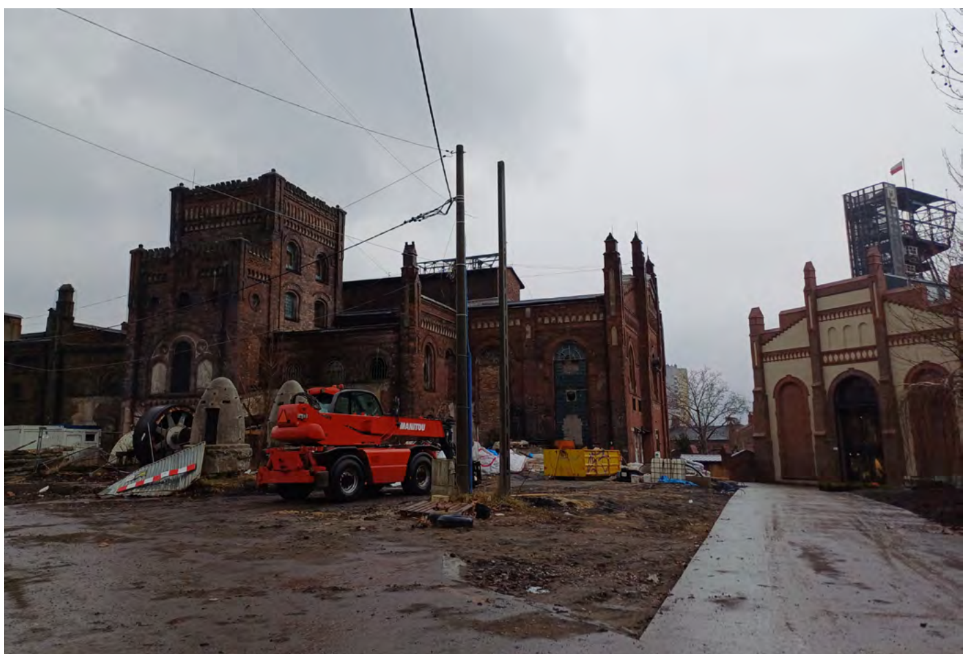
Probíhající rekonstrukce areálu. Vpravo rekonstruovaný otevřený depozitář techniky.