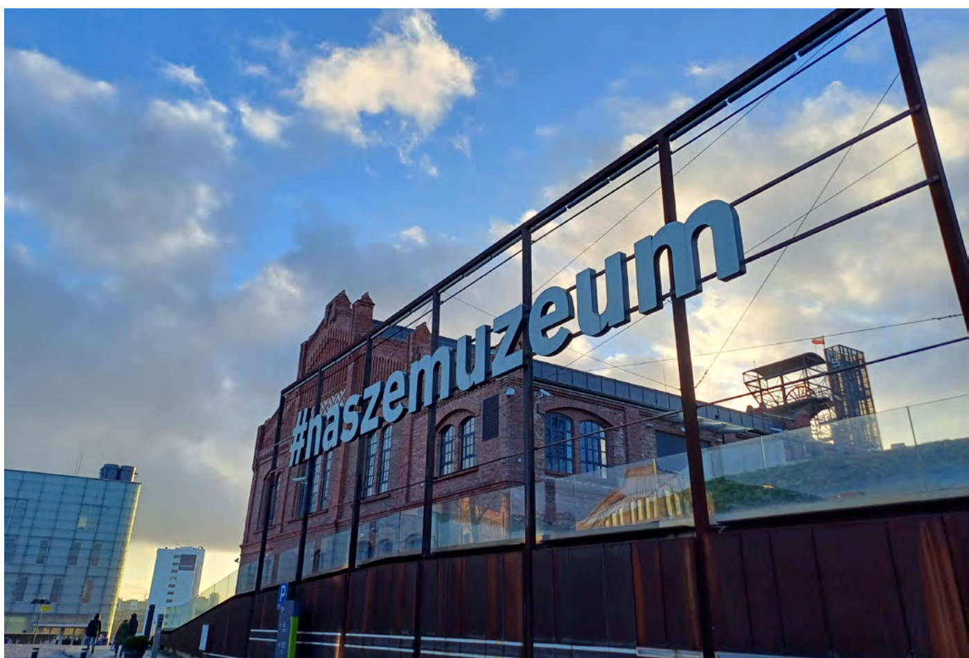
Vstup do areálu muzea a jeho využití k propagaci.