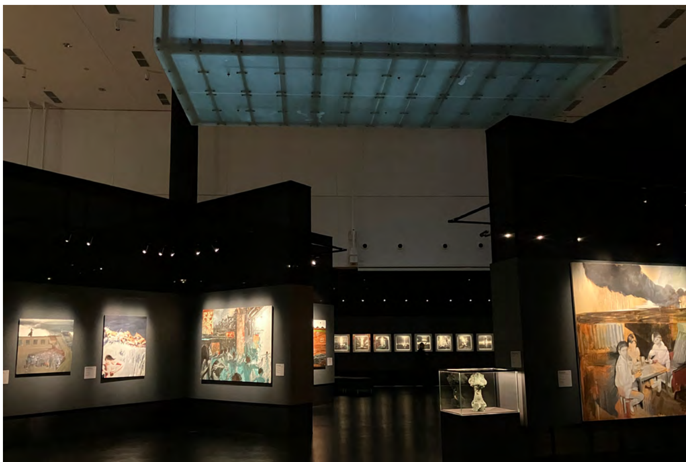
Osvětlení výstavních prostor skrze kubické světlíky.