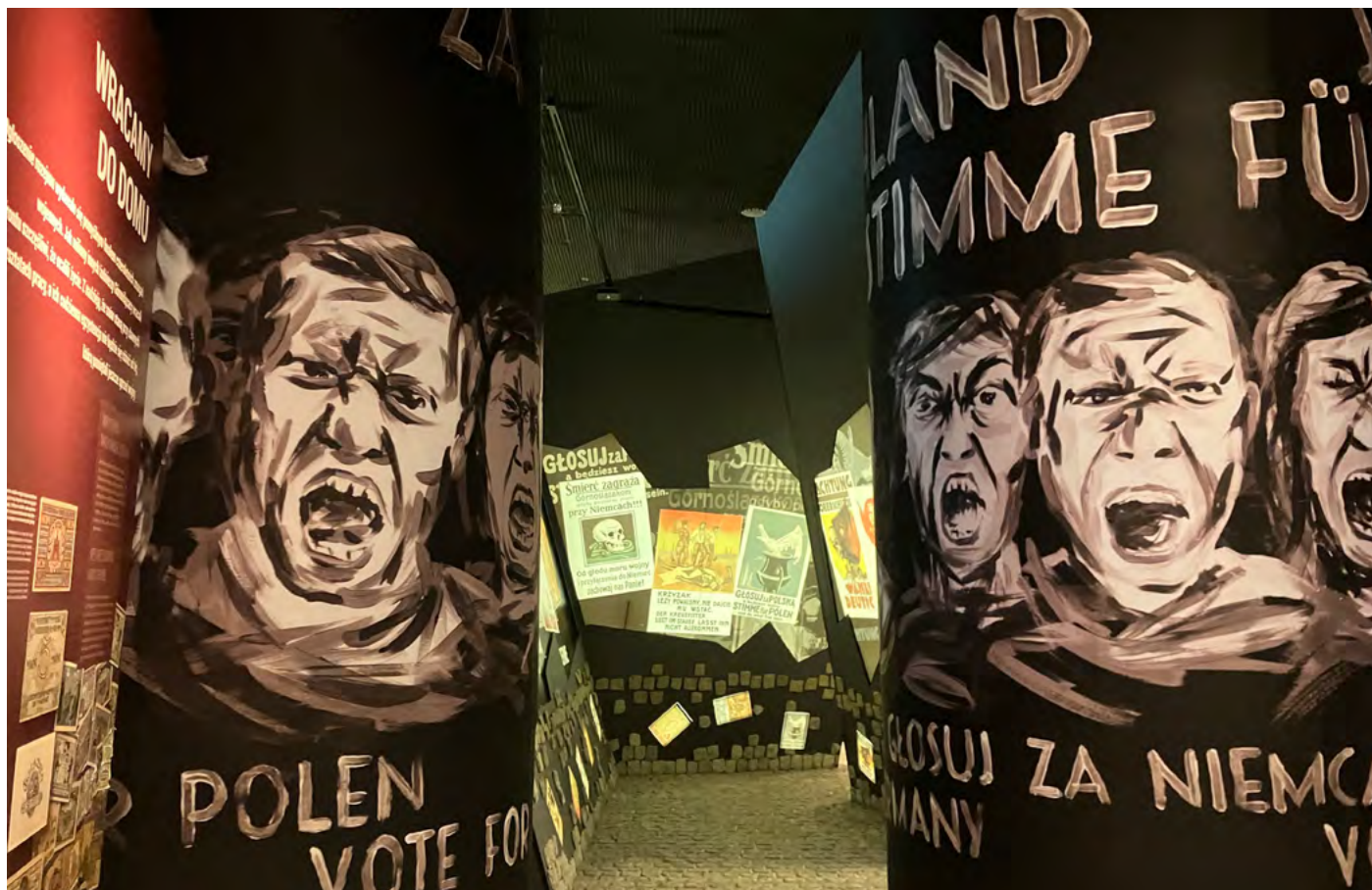
Scénografické prvky v historické expozici Světlo dějin: Horní Slezsko v historii.