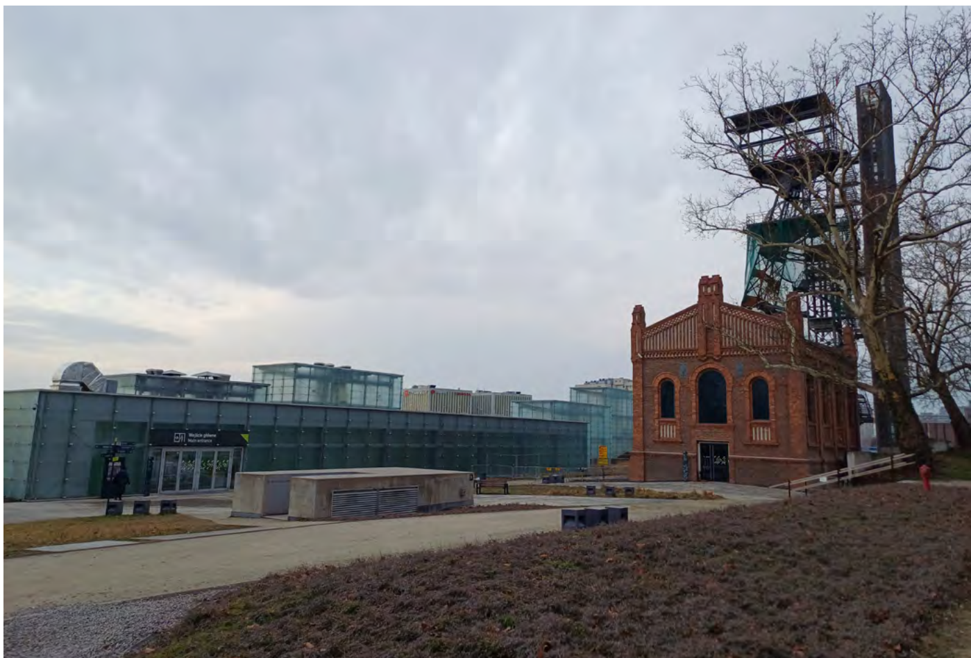
Pohled na vstup do návštěvního centra.