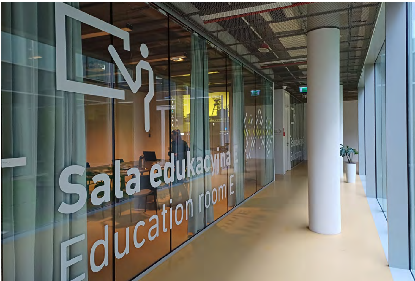
Edukační prostory muzea.