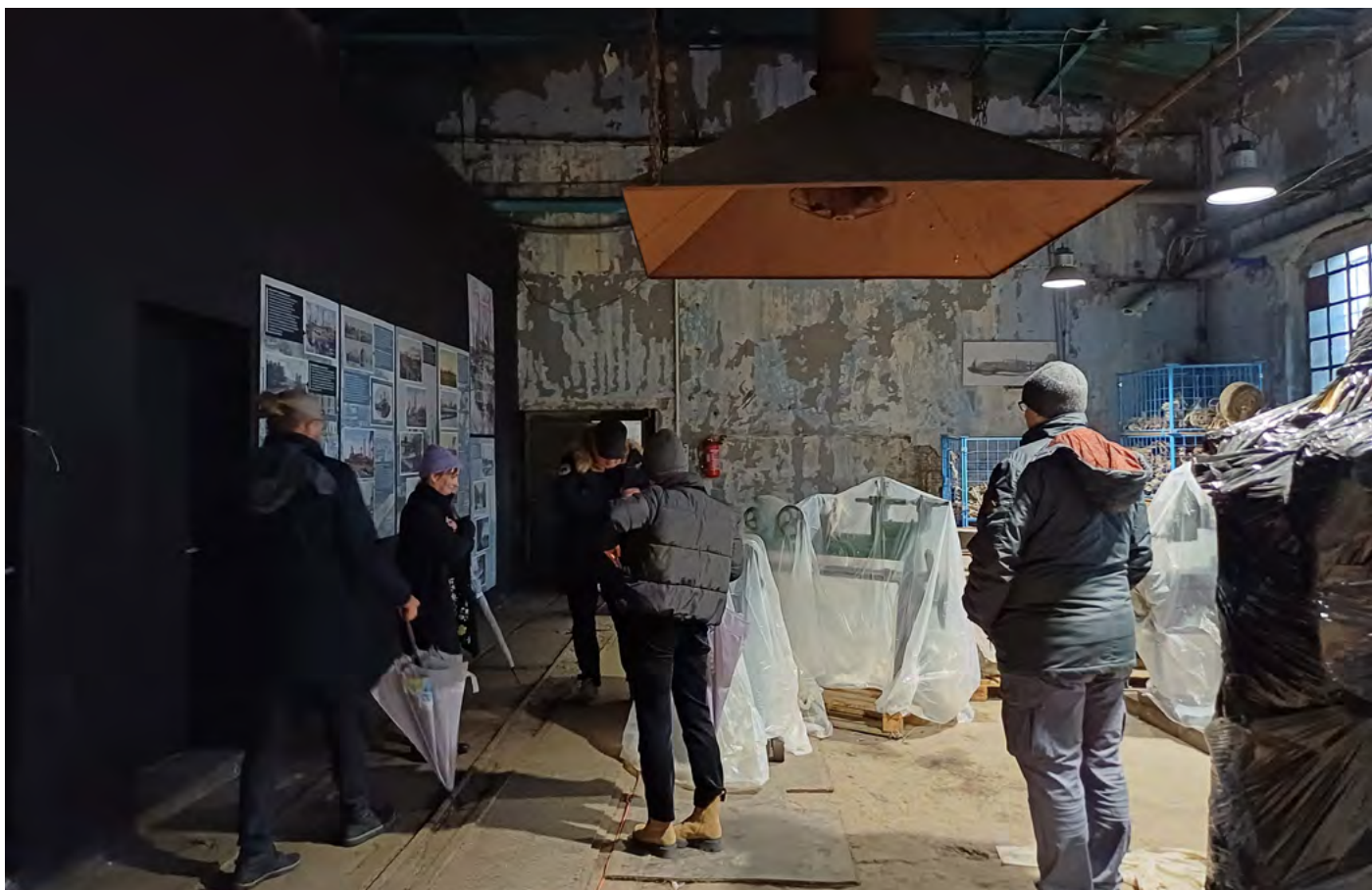
Prohlídka depozitáře muzea.