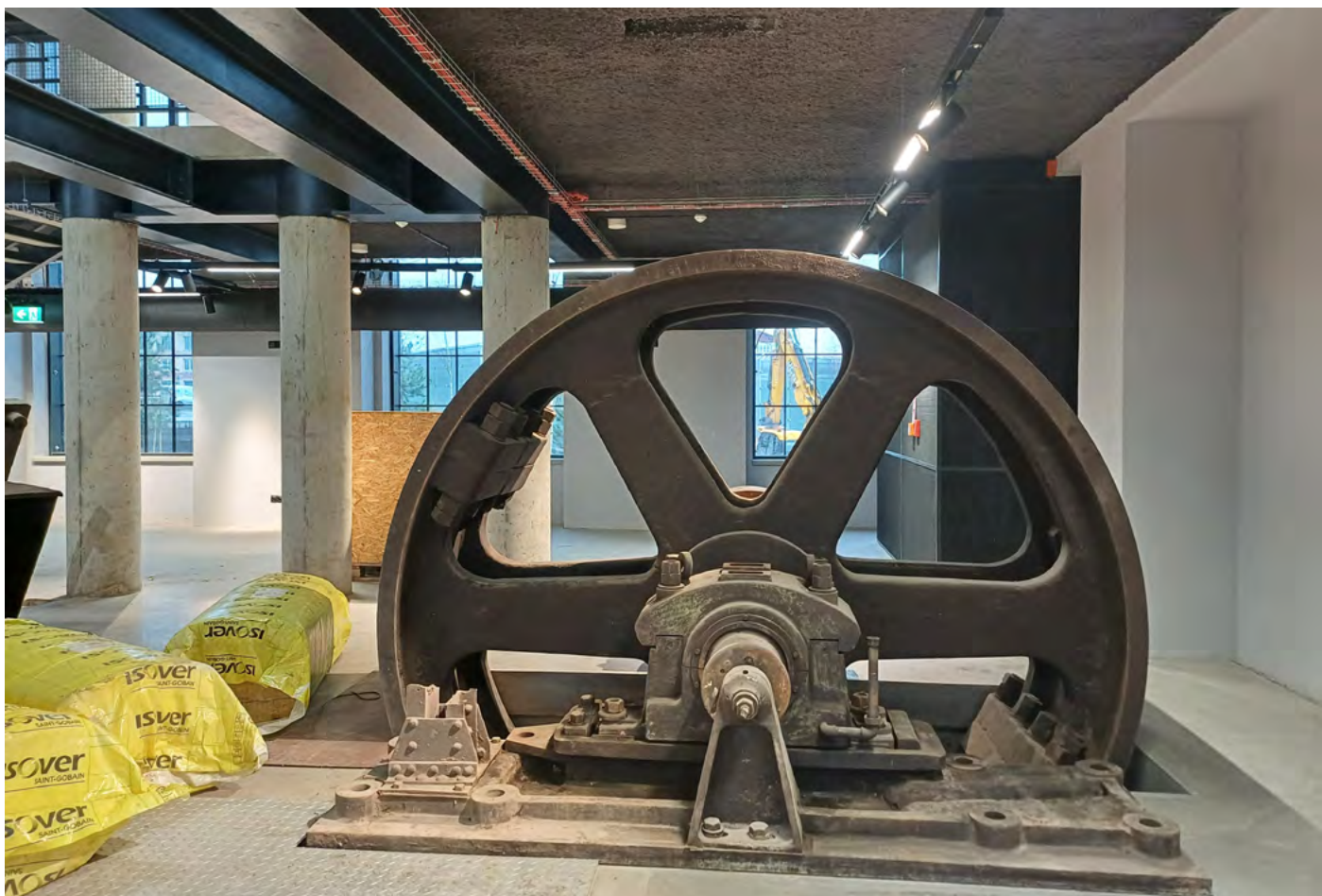
Příprava na instalaci parního stroje do otevřeného depozitáře, který se v roce 2025 dokončuje.