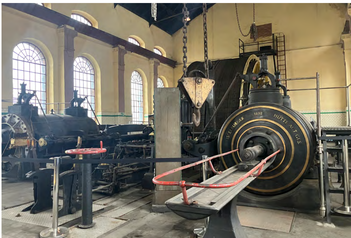
Nejstarší dochovaný parní stroj v Horním Slezsku. V budoucnu součástí samostatné prohlídky muzea.